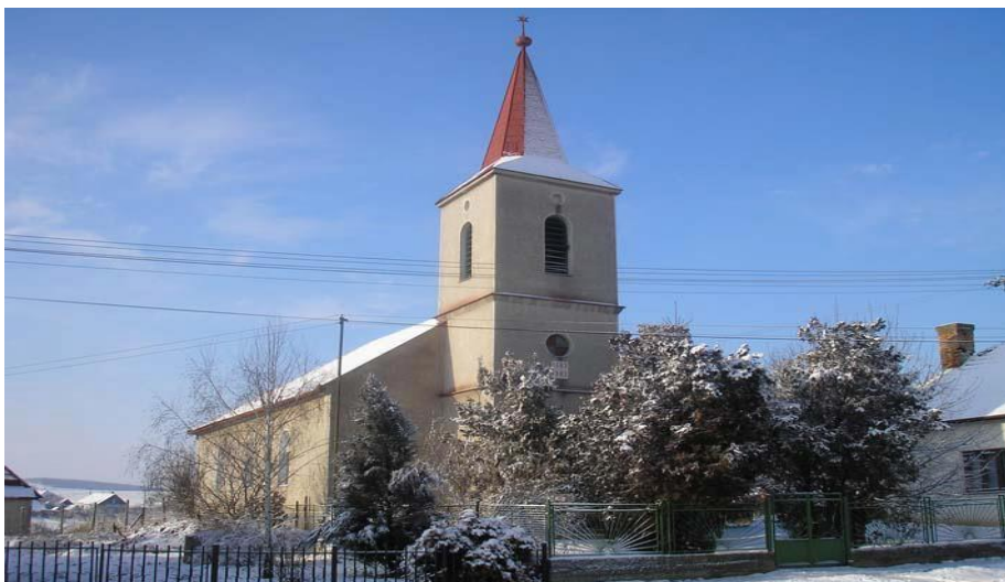
Kostol reformovanej kresťanskej cirkvi