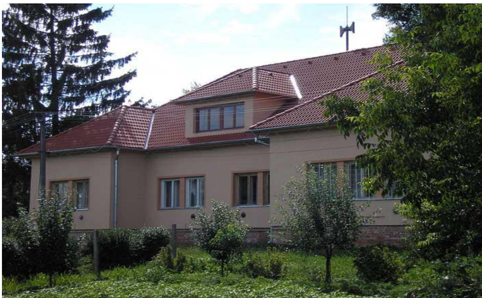
Budova Obecného úradu

Rozpočtové organizácie obce – nie sú zriadené