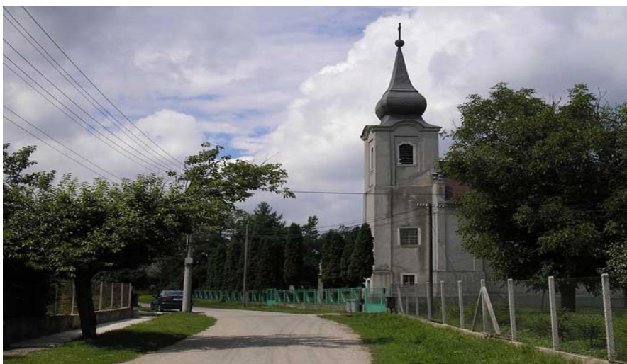
Kostol rímskokatolíckej cirkvi

Medzi pamätne stavby obce Beša patrí rímskokatolícky kostol Sv. Anny z roku 1770. Medzi mladšie pamätihodnosti môžeme zaradiť kostol reformovanej kresťanskej cirkvi , ktorý bol vybudovaný v roku 1963 a drevenú zvonnicu v centre obce.