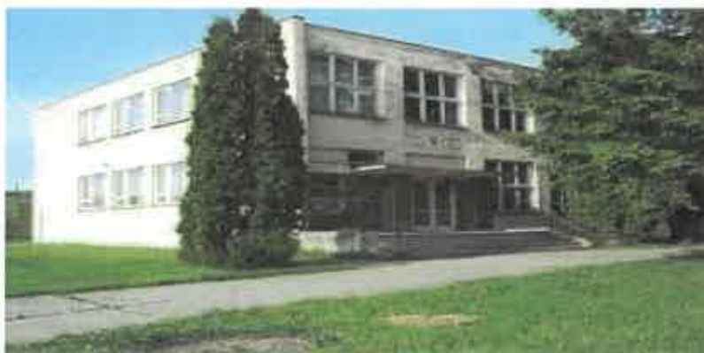
Budova materskej školy

V súčasnosti výchovu a vzdelávanie detí v obci poskytuje Materská škola Beša.