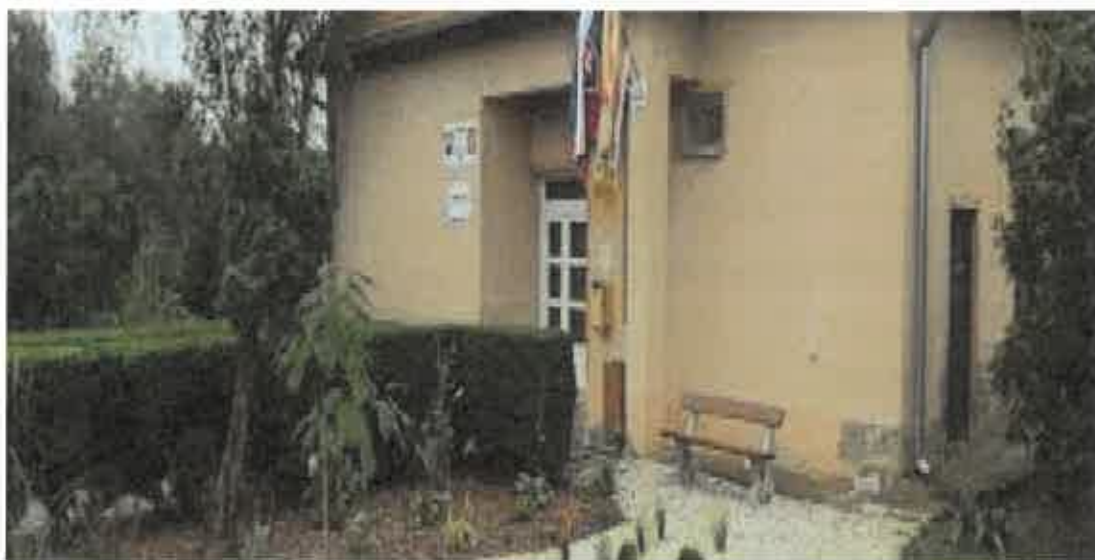
Budova Obecného úradu