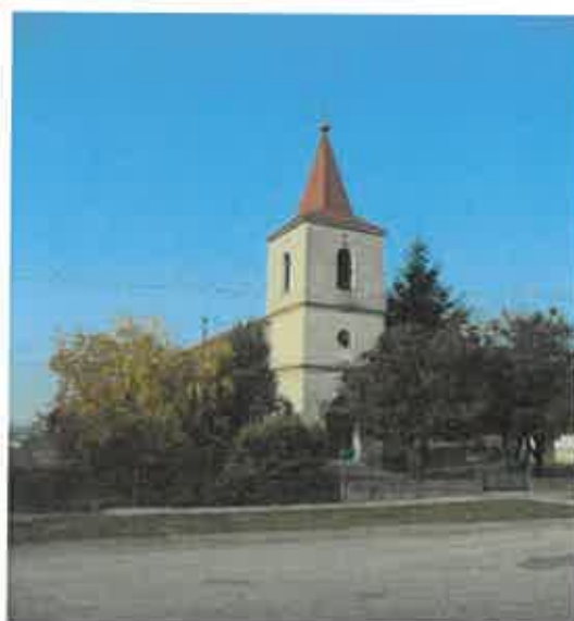
Kostol reformovanej kresťanskej cirkvi