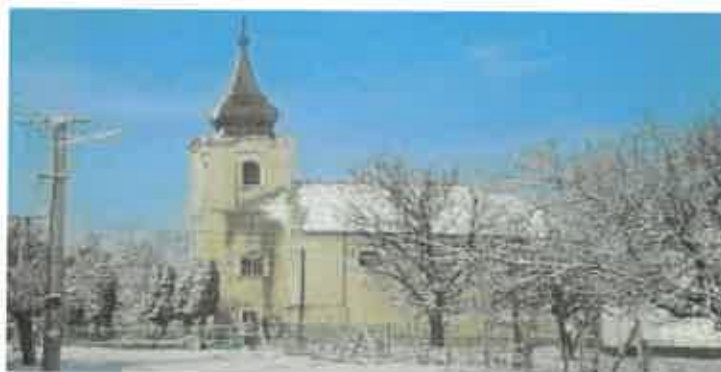
Kostol rímskokatolíckej cirkvi

Medzi pamätne stavby obce Beša patrí rímskokatolícky kostol Sv. Anny z roku 1770, ktorý bol vyhlásený za národnú kultúrnu pamiatku. Medzi mladšie pamätihodnosti môžeme zaradiť kostol reformovanej kresťanskej cirkvi, ktorý bol vybudovaný v roku 1963 a drevenú zvonicu v centre obce.